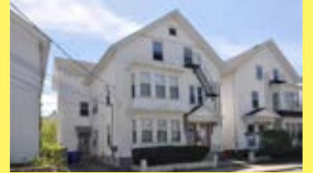
3 famílias PAWTUCKET $189.900