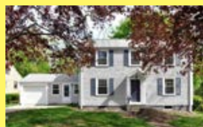
Colonial EAST PROVIDENCE $279.900