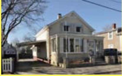
Cottage EAST PROVIDENCE $169.900

• Várias casas à venda • Preços baixos • Juros continuam baixos