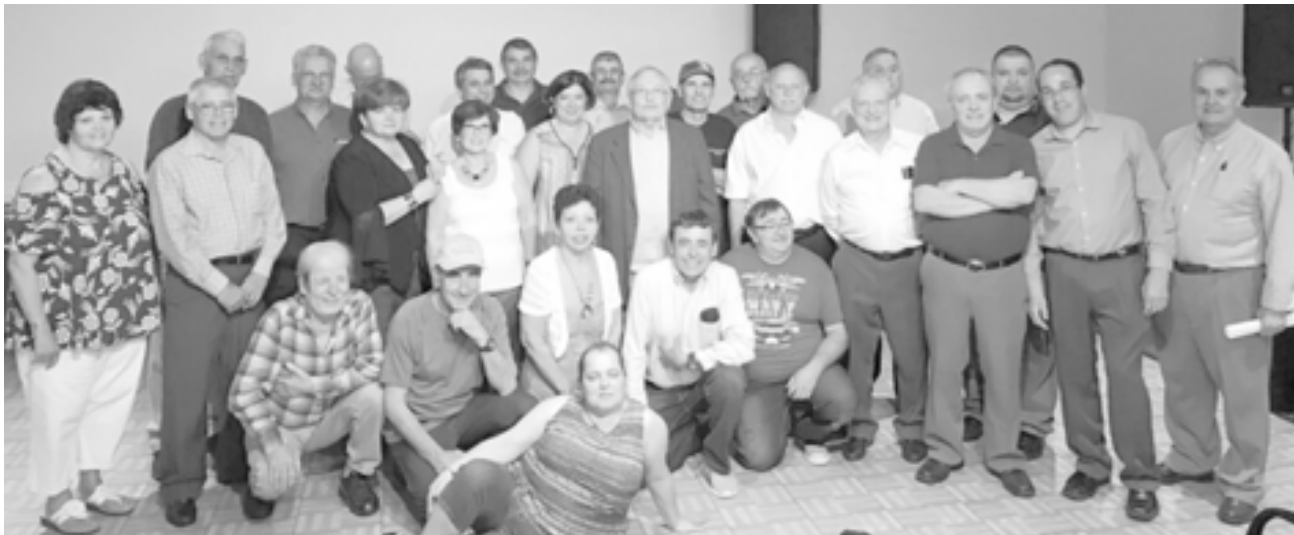
O grupo de participantes do torneio de sueca que teve por palco a Banda de São João de Stoughton.