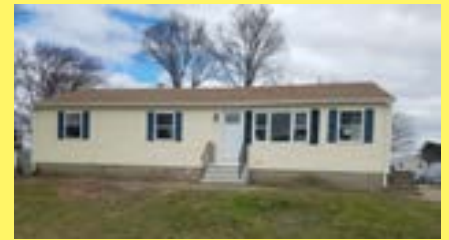
Ranch EAST PROVIDENCE $259.900

Contacte-nos e verá porque razão a MATEUS REALTY tem uma excelente reputação