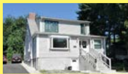
Cape CRANSTON $239.900