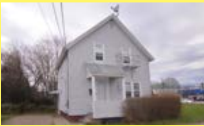
2 famílias EAST PROVIDENCE $139.900