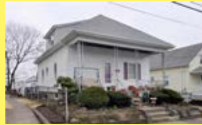
Bungalow PAWTUCKET $179.900