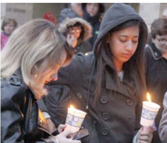
Na foto acima as senhoras da Irmandade do Rosário que tomaram parte na procissão de velas em honra de Nossa Senhora de Fátima pelas ruas de Cumberland.