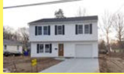
Colonial RUMFORD $279.900