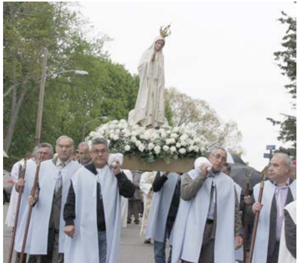
O andor com a imagem de Nossa Senhora de Fátima transportado pelos paroquianos.

Missão de Nossa Senhora de Fátima era localizado nas esquinas da Broad Street e Meeting Street. Seria a primeira congregação dedicada a Nossa Senhora de Fátima nos EUA e possivelmente a primeira fora de Portugal.