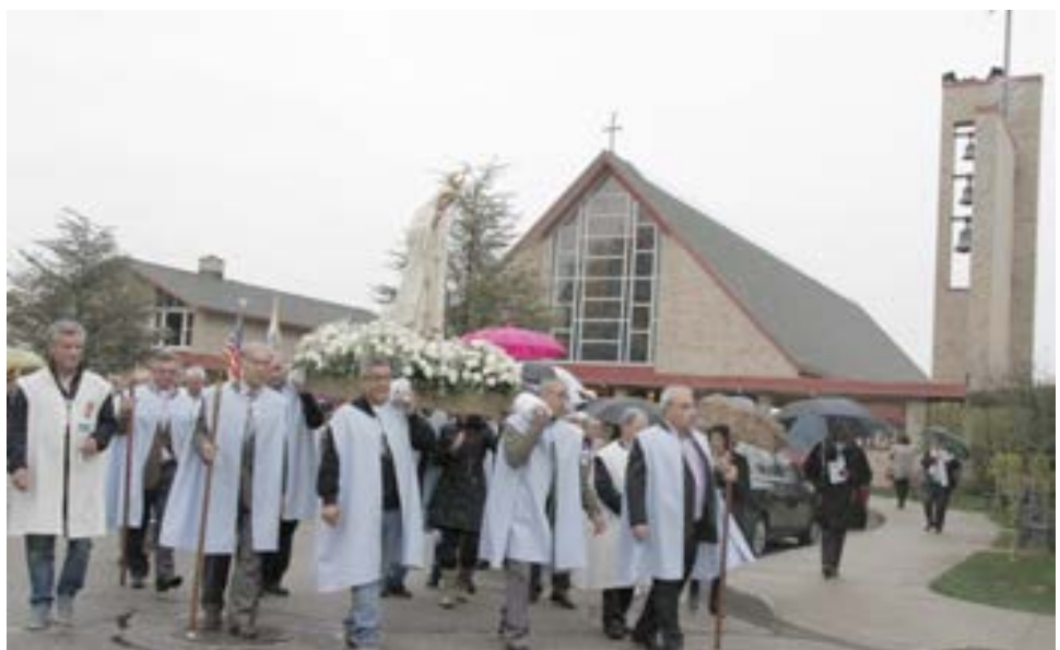
Na foto abaixo, a imagem de Nossa Senhora de Fátima transportada pelos fiéis e passando em frente à igreja daquela invocação.