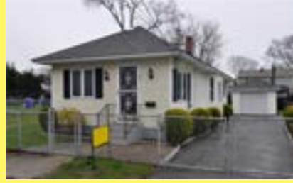
Bungalow RIVERSIDE $169.900