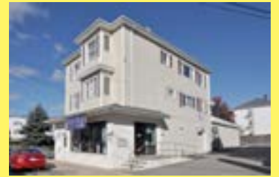
Comercial/2famílias NORTH FALL RIVER $279.900