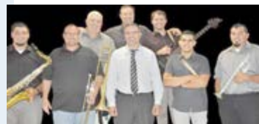
BANDA SEM DÚVIDA