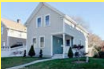
Colonial CENTRAL FALLS $169.900