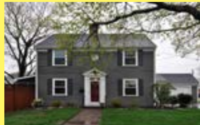
Colonial KENT HIGH $299.900