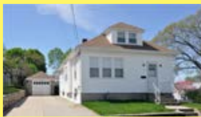
Bungalow EAST PROVIDENCE $179.900