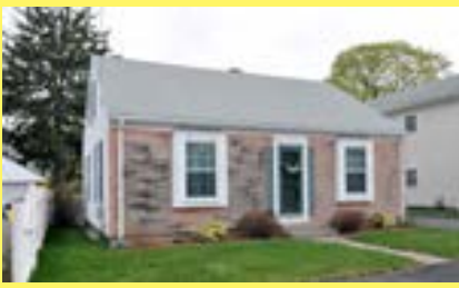
Cape PAWTUCKET $189.900