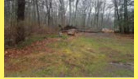
Terreno REHOBOTH $169.900